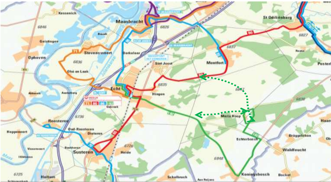
Figuur 1 De groene route is het buurtbusje dat tussen Maria-Hoop (via Koningsbosch) en Echt op en neer rijdt. De groene gestippelde lijnen zijn alternatieven.

Een aantrekkelijker buurtbusje maakt de voorzieningen in de omliggende dorpen beter bereikbaar.